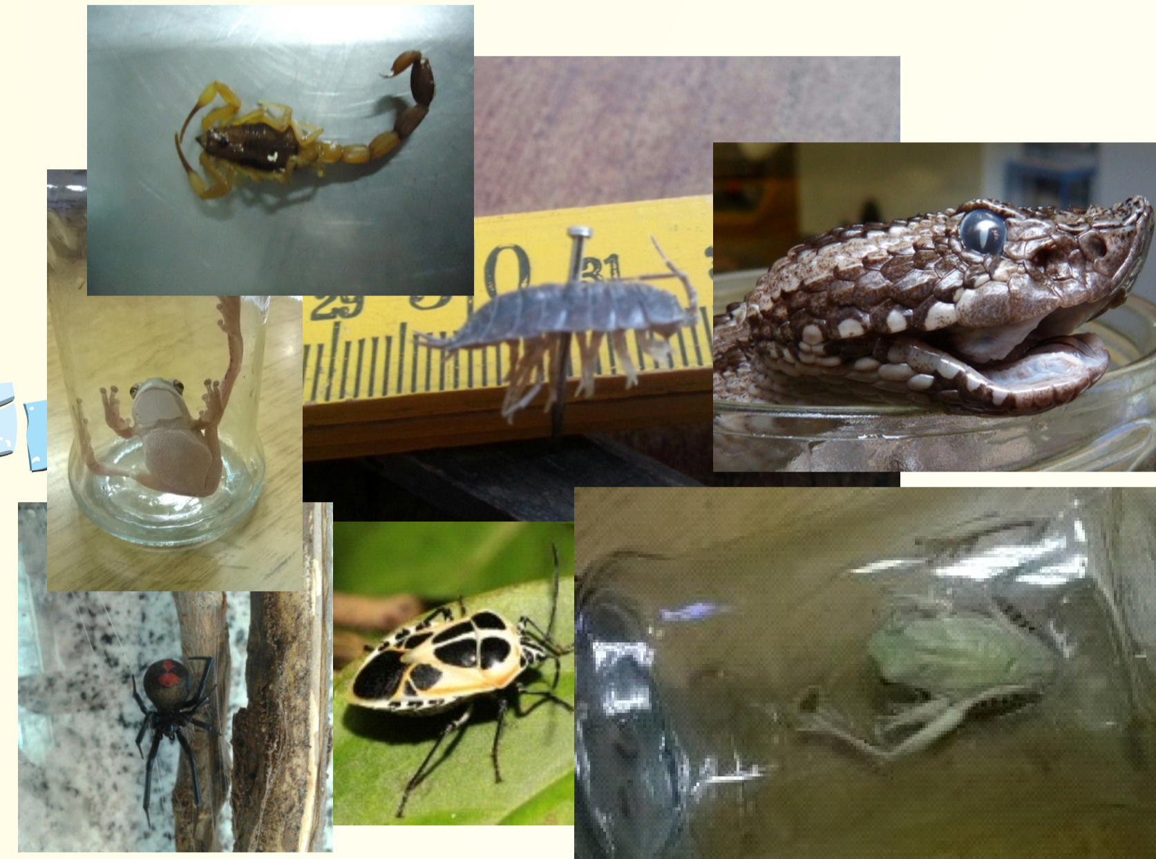
Material Vivo- muerto-fragmentado-fotos